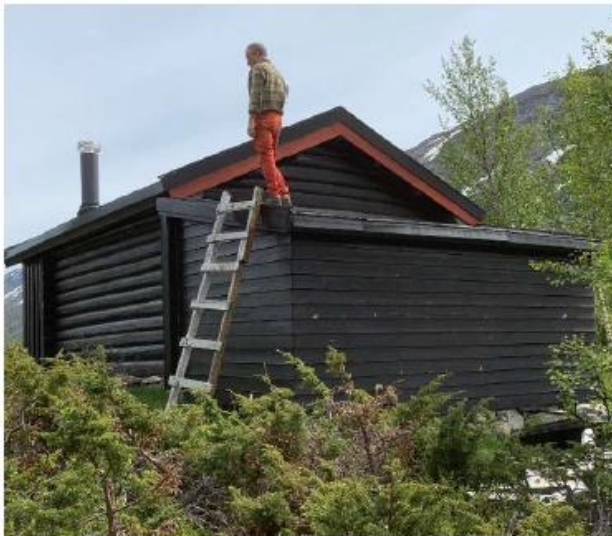
Gavlvegg mot vest med tilbygget vi vil rive.