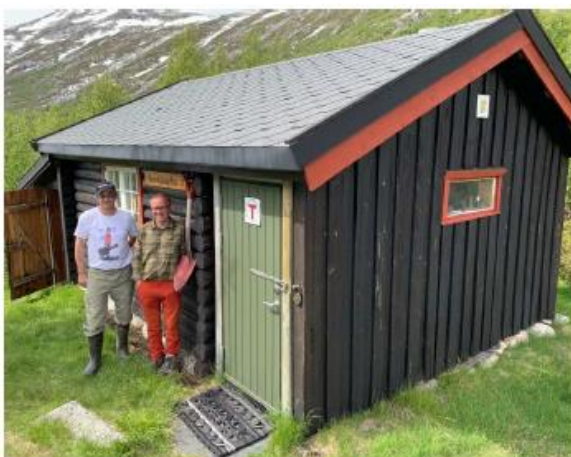
Befaring sommer 2019.