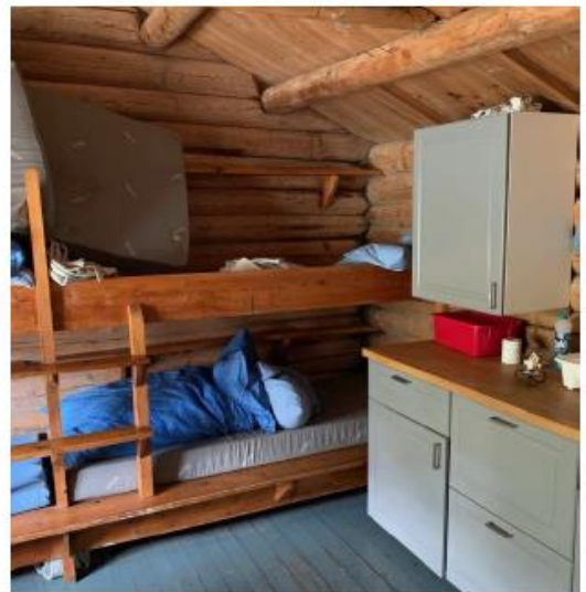
Køyesenger inn mot den skadde vestveggen.