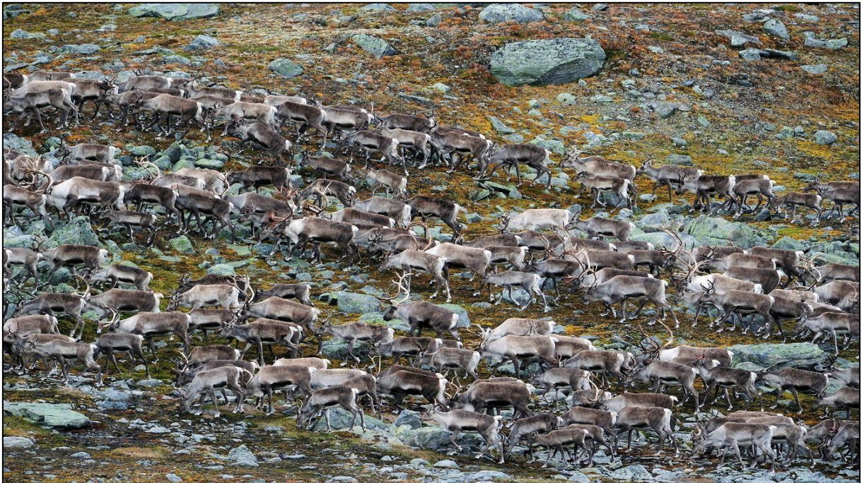
Villrein, Leirsjøetelet, Lesja kommune, foto: Bjørn Rangbru