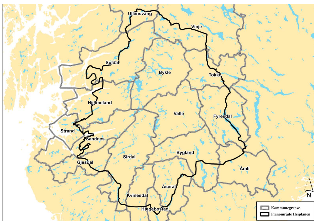
Kartet viser den geografiske avgrensinga til planområdet, svart strek, til Heiplanen, til omsynssone nasjonalt villreinområde, blå strek, og til verneområda i Heiplanen, raud skravur

Heiplanen omfattar etter regionreforma 2020, fylkeskommunane Vestland, Rogaland, Agder og Vestfold og Telemark. I 2024 skil Vestfold og Telemark lag og Telemark fylkeskommune blir med i Heiplanen. Det er 18 kommunar som er omfatta av Heiplanen. Reelt er det 17 kommunar som er med. Strand kommune har grunna svært lite areal i planområdet, ei heller areal i omsynssone nasjonalt villreinområde, ikkje delteke i planarbeidet og i oppfølginga av Heiplanen. Etter kommunereforma, er Forsand og Sandnes slått saman til Sandnes kommune og Odda kommune er slått saman med kommunane Jondal og Ullensvang til Ullensvang kommune