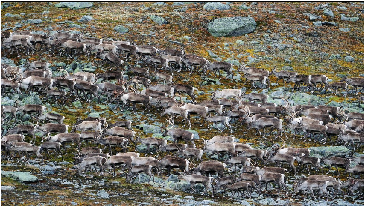
Villrein, Leirsjøetelet, Lesja kommune, foto: Bjørn Rangbru