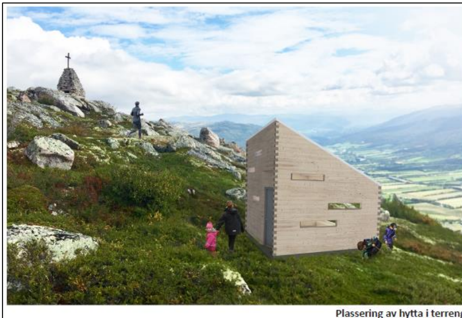
Fotomontasje av «Nye Tussheim» (Streken AS september 2018).