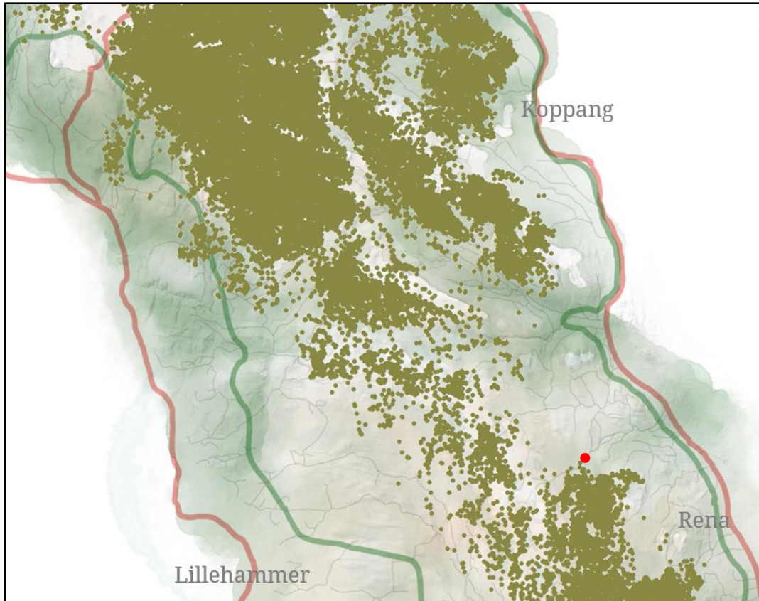
Figur 2. GPS-merkede simler i perioden mars 2010 tom april 2018. (Rød viser eiendommens plassering)