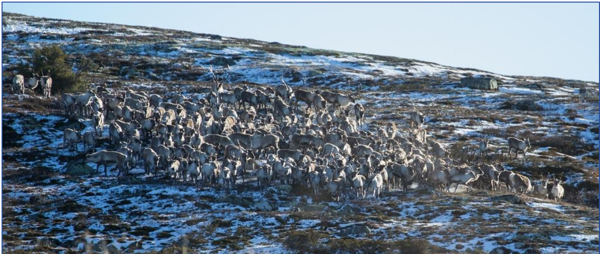
Reinsflokk i Rondane Sør – 29.10.16