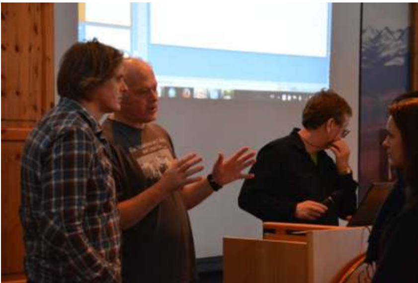
Engasjement under presentasjonen av GPS-prosjektet for Rondane i januar 2015.

Planlagt i 2015: Delta i oppfølging av fokusområdene mht. planlegging og evt. gjennomføring av tiltak. Fokus på og oppfølging av enkeltsaker og planer som er viktige i forhold til områdenes funksjon.