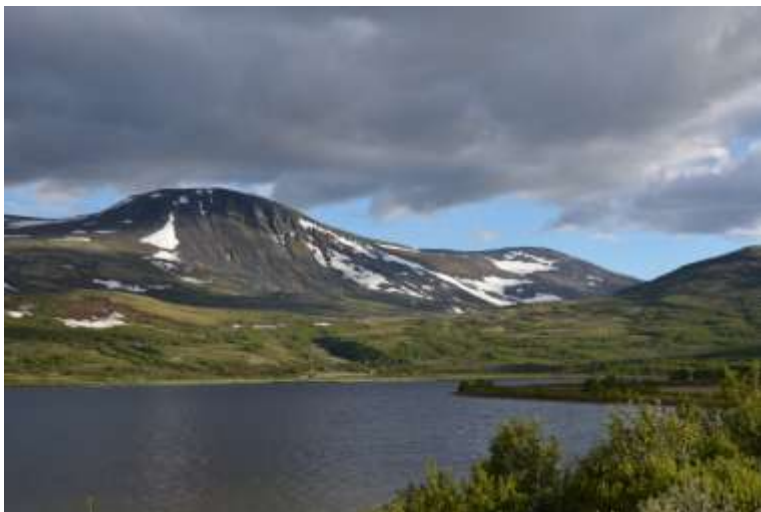
Parti fra Dovre nasjonalpark.

Det føres postliste for inngående og utgående brev. Postlista distribueres til nemndmedlemmene ca. en gang pr. mnd og legges ut på hjemmesiden. Møteprotokoll og annen informasjon legges også på www.villrein.no . Nemnda har et elektronisk arkiv som den selv har bygget opp.