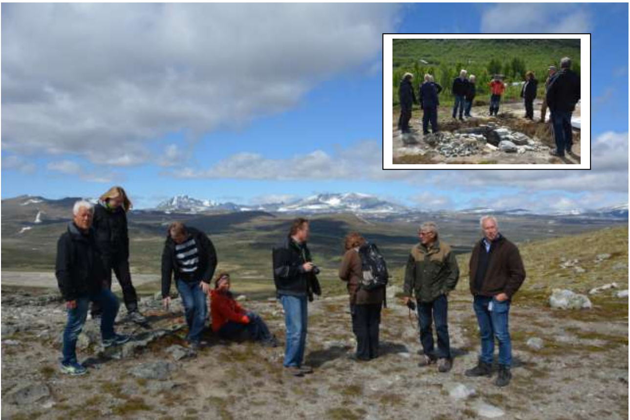
Villreinnemnda på Viewpoint Snøhetta og Villreinsenteret i juni. Vignett fra Fangstminneparken under bygging.