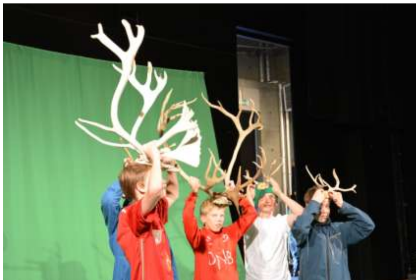
Elever fra Sel ungdomsskole med på filminnspilling – prosjekt "Villrein som verdiskaper".

Planlagt i 2015: Videreføre deltagelsen i Rådgivende utvalg. Løpende kontakt med nasjonalparkforvalterne.