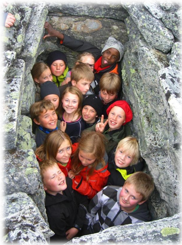
Elever ved Dombås skole prøver "grav 380" på sin årlige ekskursjon til Storvatnet og Gravhøe.