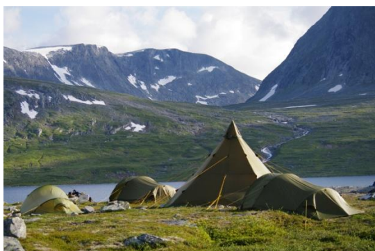
Fra leiren for ungdom i alderen 10- 15 år ved Reinsvatnet i Sunndal.

Muligheten for å søke om tilskudd til villreintiltak ble kunngjort med en søknadsfrist 15. juni 2011. Ved fristens utløp var det kommet inn 4 søknader, samt at søknaden fra Dombås skole ble tatt opp igjen. Villreinutvalgene fikk tilskudd til å dekke kostnader de har ved ulike tellinger i villreinstammen, oppsynsrapport og jaktfoldere. Videre ble det bevilget tilskudd til to fjellstyrer for ulike aktiviteter og tilrettelegging for barn og unge, samt tilskudd til et skoleprosjekt om villrein på Dombås skole.