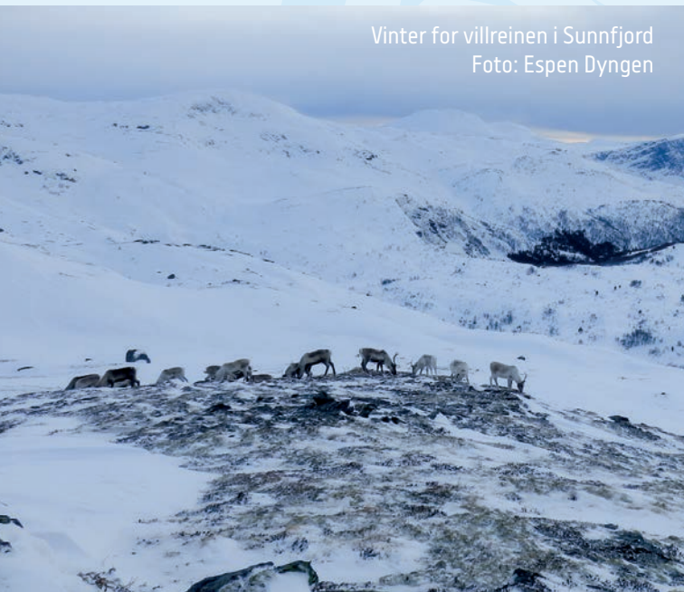
Vinter for villreinen i Sunnfjord

Reinsdyr vil halde seg unna område med høg menneskeleg aktivitet. Tiltak som skapar ferdsel har større verknad enn fysiske installasjonar som står i ro, om desse ikkje ligg slik at dei hindrar trekkruiter. Turstiar og skiløyper med høgt bruk kan skape ei barriere for rein om dei ligg på tvers av ei av dyra sine faste trekkruiter. Med god lokalkunnskap kan me legge turstiane våre slik at me kan nyte naturen utan å påverke villreinen.