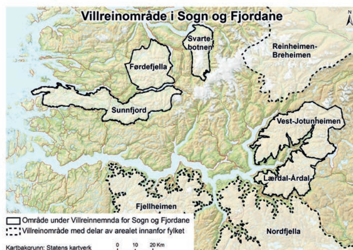
○ Område under Villreinnemnda for Sogn og Fjordane ⋯ Villreinområde med delar av arealet innanfor fylket Kartbakgrunn: Statens kartverk 0 10 20 Km