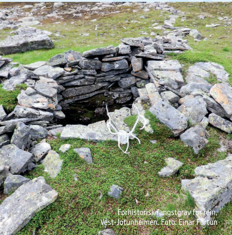
Forhistorisk fangstgrav for rein, Vest-Jotunheimen.