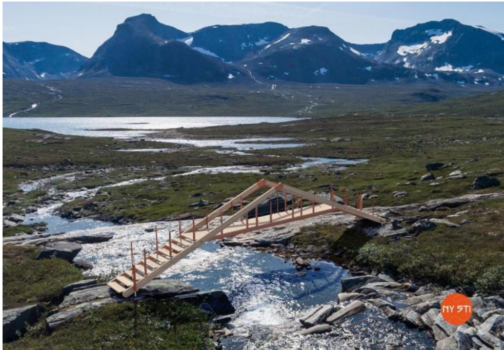
Utkast til ny bru nord for Reinsvatnet (NySti AS)